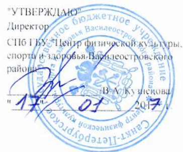
График приема нормативов ВФСК ГТО Центром тестирования ВФСК ГТО Василеостровского района на февраль 2017 года