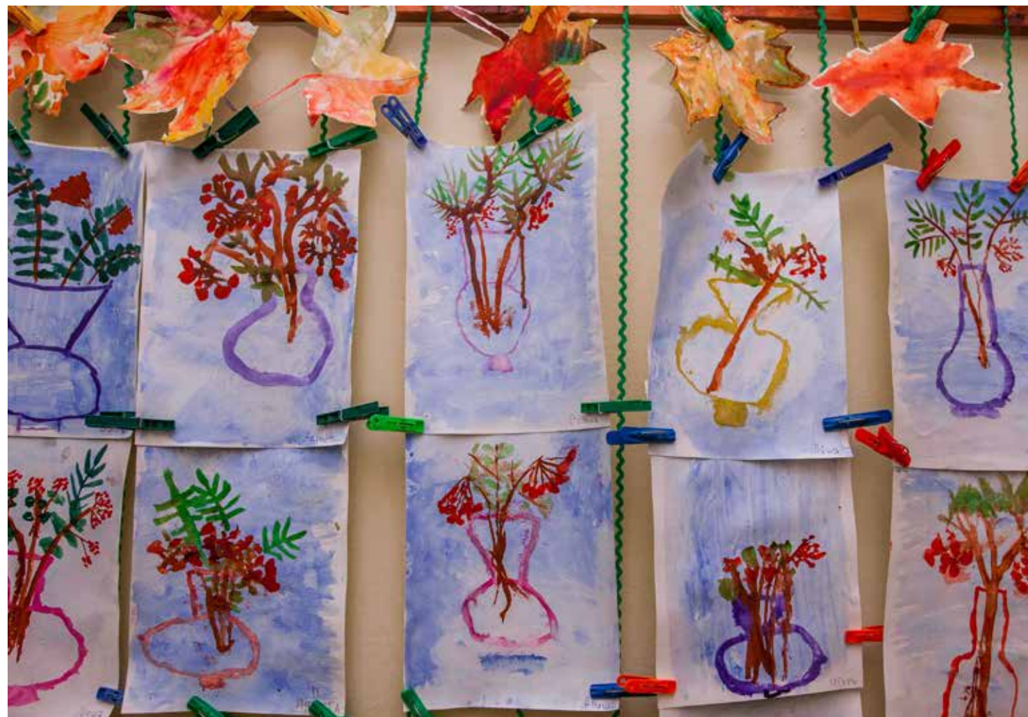
В рубрике представлены лучшие работы детей из детского сада № 24.